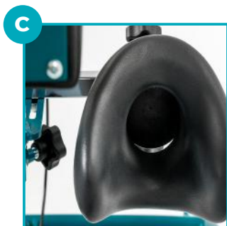
Ginocchiera con scarico rotuleo