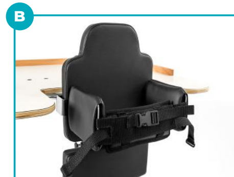
Supporto laterale del tronco