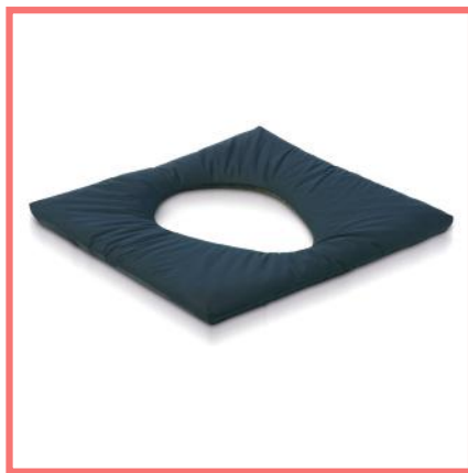
Cuscino con foro