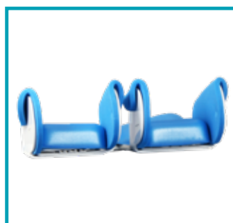
Abduzione e adduzione