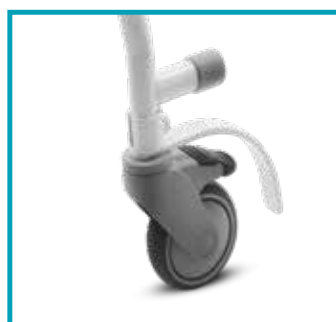
Ruote piroettanti con freno