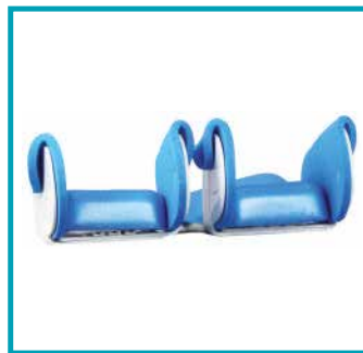
Abduzione e adduzione