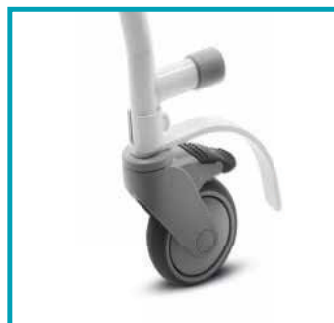
Ruote piroettanti con freno