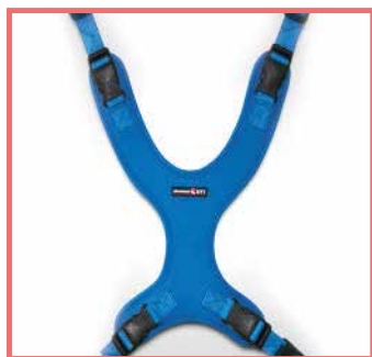
Stabilizzatore V PRO