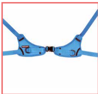
Antirotazione del bacino