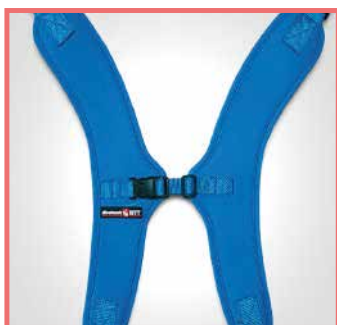
Pettorina ad H