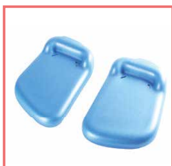
Imbottitura pedana separata