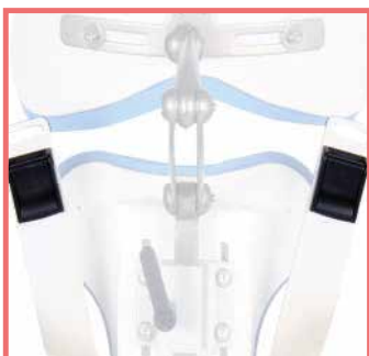
Supporti per PM Pettorina