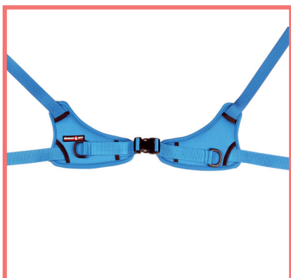
Antirotazione del bacino