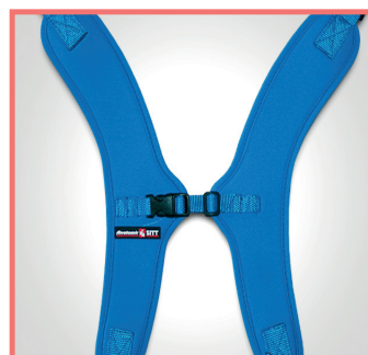
Stabilizzatore ad H