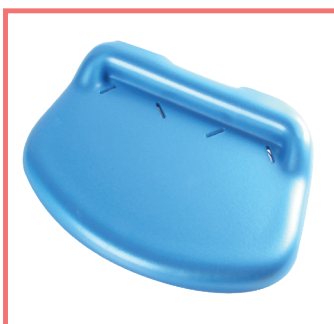
Imbottitura pedana unica