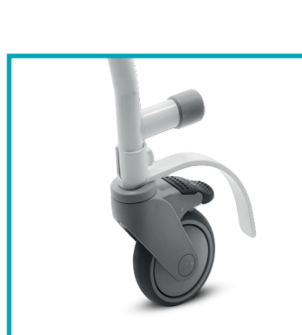
Ruote piroettanti con freno