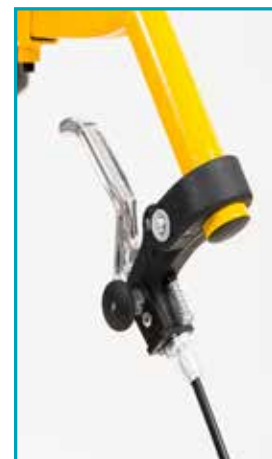
Leva per pronazione