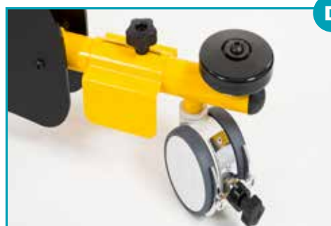
Regolatore resistenza ruota