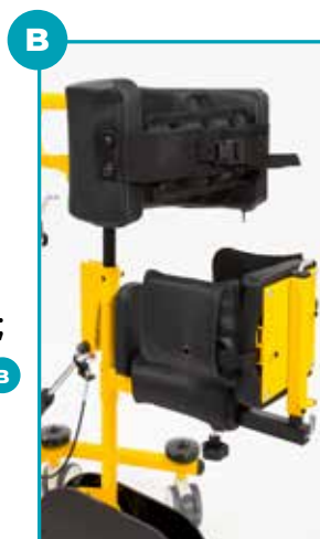
Contenimento tronco e spinta posteriore bacino