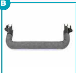
Barra di sicurezza