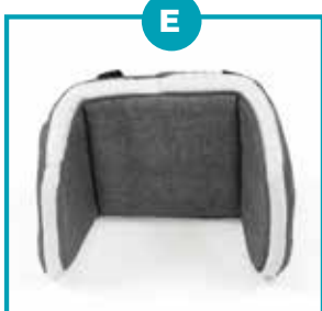
Riduttori capo e tronco