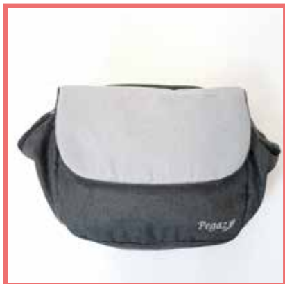
Borsa da viaggio

Il passeggino Pegaz è abbinabile al “Kit Mamma Felice” che comprende borsa da viaggio, cappottina apribile, zanzariera, parapigioggia, ombrellino, copri-gambe ed il porta-oggetti.