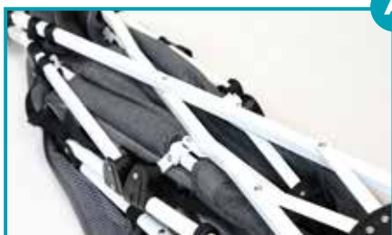
Passeggino chiudibile ad ombrello