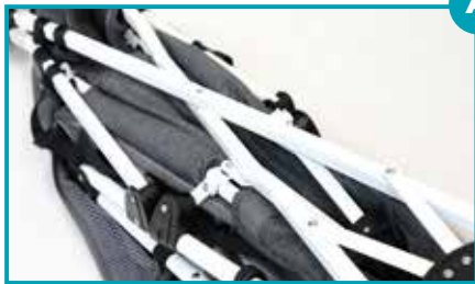
Passerino chiudibile ad ombrello