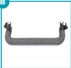
Barra di sicurezza